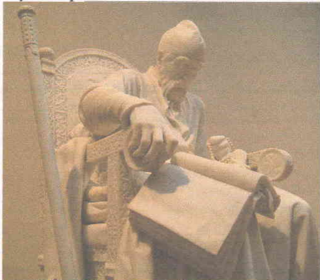
А. Иван Бржанецъ XVII в