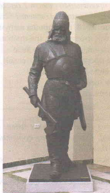
Г. Ерекла Тимидзевлишви XVIII в

13. Прочитайте отрывок из исторического источника и ответьте на вопросы. Всего 5 баллов.