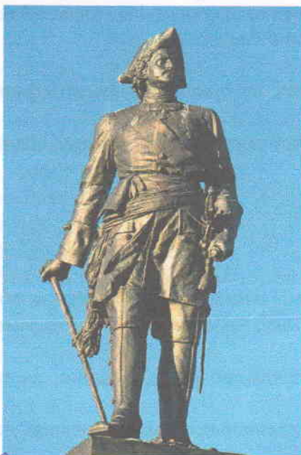
В. Петр I Романов XVII-XVIII в